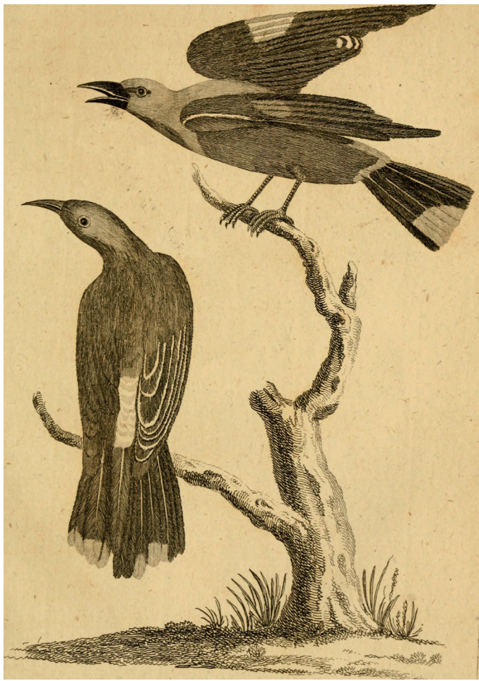
Pennant, Thomas, 1726–1798. British zoology (1776).